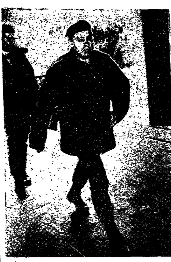
האלוף יצחק רבין, מנחה מוקדם הרמטכ"ל, בחדר לישיבת הממשלה, אתמול, מיד לוחם על הכובע בחינת הסורית

מזג האוויר: מזג האוויר יום: מעוננים מלך חום במשך רוב שעות היום. ירושלים: 28 מעלות, תל אביב: 26 מעלות, חיפה: 24 מעלות, נהריה: 22 מעלות, יבנה: 20 מעלות, אשדוד: 18 מעלות, באר שבע: 16 מעלות, אילת: 14 מעלות.